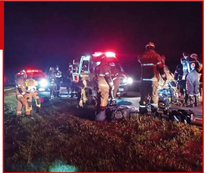
Vítimas foram encaminhadas para hospitais da região