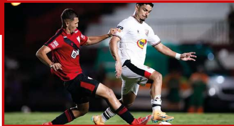
Heber Gomes/Mais Goiás

Do outro lado, o Anápolis também demorou a se achar, principalmente por vir com