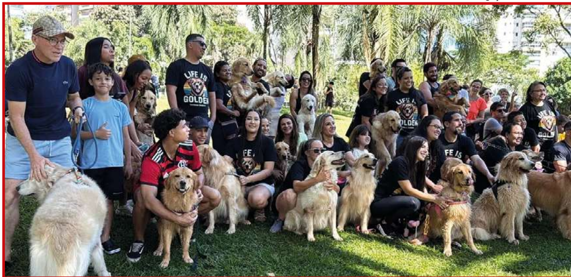
Divulgação Goldens Goiânia